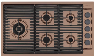
OUTLINE GAS - COPPER 7440 008