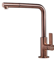
VELA PLUS COPPER 8498 128