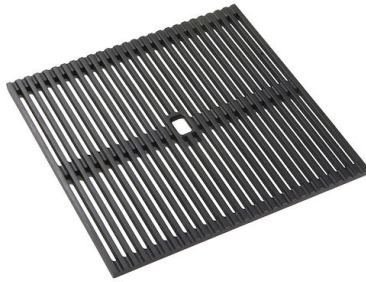
黑色网格 8100 606